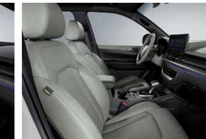
ΧΑΚΙ & ΜΑΥΡΗ ΤΑΠΕΤΣΑΡΙΑ