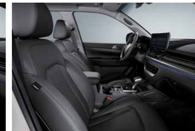
ΜΑΥΡΗ & ΓΚΡΙ ΤΑΠΕΤΣΑΡΙΑ